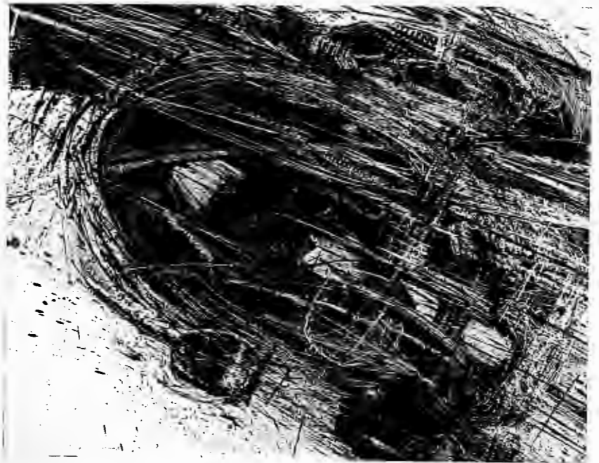
2. VIII. 55