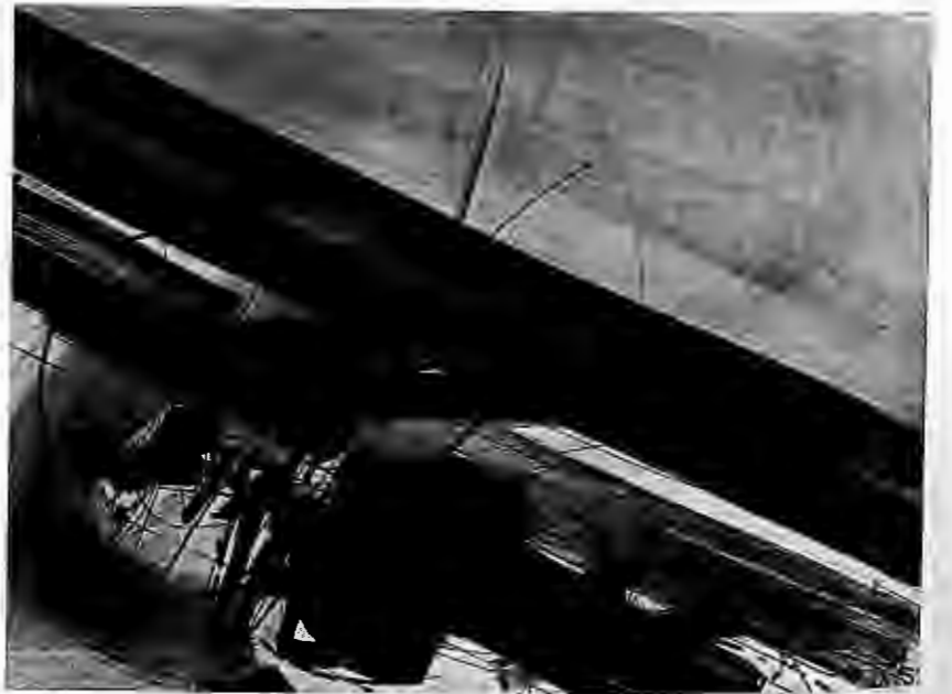
Plus vite que le son, 1953.